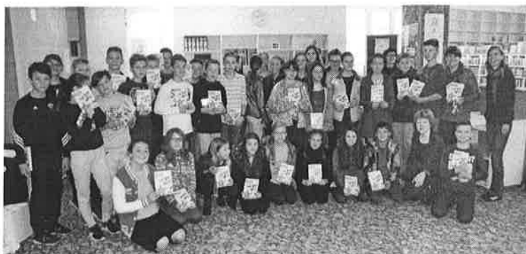
Druženje med obiskom knjižnice ob projektu Rastem s knjigo