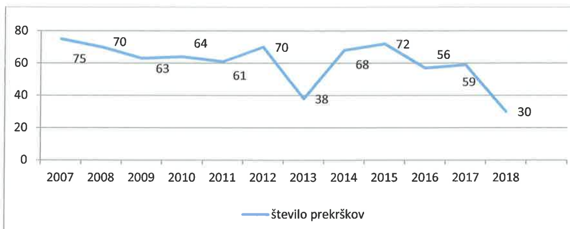
Graf 2: Število prekrškov v obdobju od leta 2007-2018

Iz grafa 2, lahko razberemo da je število prekrškov v zadnjih treh letih v upadanju.