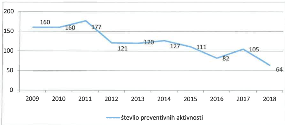
Graf 4 Število izvedenih preventivnih aktivnosti v obdobju od leta 2009 do 2018

Namen vseh dejavnosti v skupnost usmerjenega policijskega dela je bilo približevanje policijskih storitev ljudem in zagotavljanje stalne navzočnosti policistov, predvsem vodij policijskih okolišev med ljudmi, s čimer naj bi policija prispevala k povečanju njihove varnosti.