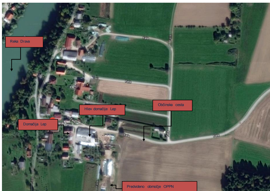
Slika 2: Območje OPPN za gradnjo kmetijskih objektov kmetijskega gospodarstva z ID. št. KMG-MID: 100288251