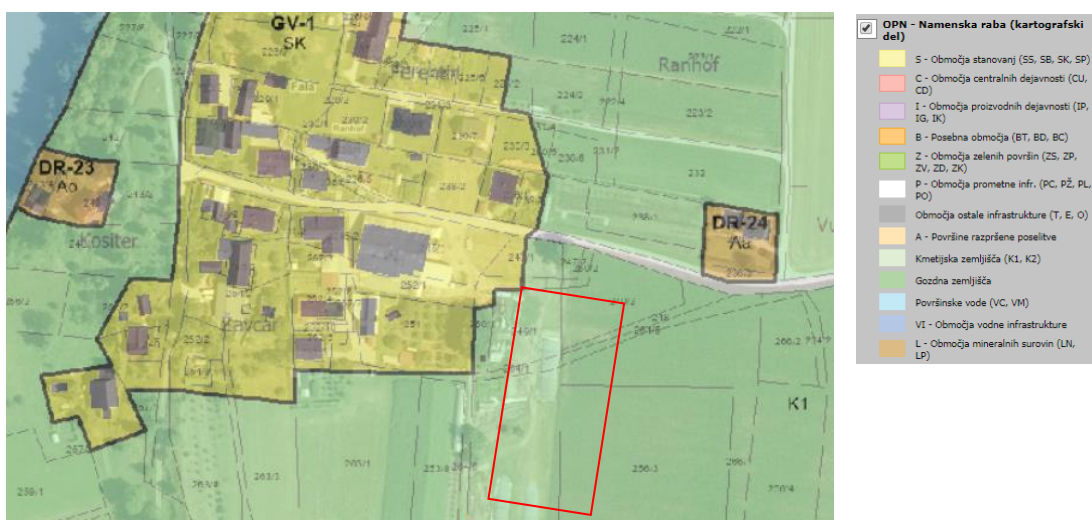
Slika 1: Podrobna namenska raba prostora obravnavanega območja

Primarnega pomena za kmetijo je izgradnja dveh novih kmetijskih stavb (hlevov). Znotraj območja je dovoljena tudi planirana izgradnja spremljajočih objektov (gnojna jama, nadstrešek ter ostale potrebne vsebine v skladu z dopustnimi dejavnostmi).