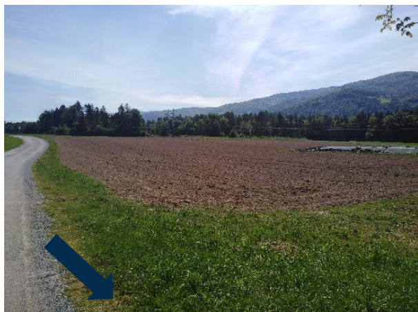
Slika 4: Območje ureditve novega cestnega priključka

Površina predvidenih utrjenih povoznih površin znaša 1.646 m 2 . Površine ne predstavljajo javnih prometnih površin.