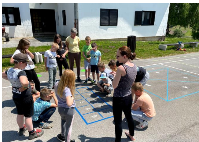
Slika 1: Izris talnih iger (avtor: Petra Leskovšek Lasetzky)

Talne igre so izjemno privlačne tako za najmlajše kot tudi malo starejše otroke, saj pripomorejo k aktivnemu učenju in zabavi na prostem. Na igrišču pri Sv. Duhu na Ostrem vrhu je tako v mesecu juniju izvajalec skupaj z učiteljico in učenci podružnične šole izvedel zaris iger. Poustvarili so šest iger: Ristanec, Pismo, Gosenica z velikimi in malimi tiskanimi črkami, Motorična pot, Punce, punce ven in Zemljevid Slovenije. Zemljevid Slovenije je zelo uporaben, saj lahko služi kot učni pripomoček pri vseh predmetih – pri matematiki lahko otroci skozi kraje rišejo premice, daljice ali poltrake, pri slovenskem jeziku lahko vadijo veliko in malo začetnico, pri naravoslovju iščejo reke, gorovja, nižavja, sosednje države in utrjujejo strani neba.