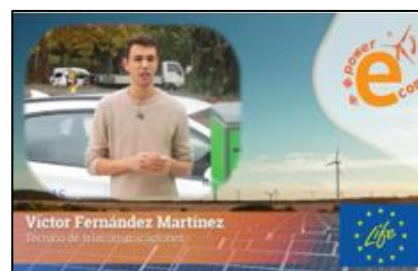
V središču pozornosti - Rivas, Madrid, Španija: Izkoriščanje sončne energije za energetsko neodvisnost