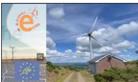
Moč skupnosti na Irskem: Zgodba o vetrni elektrarni v lasti skupnosti v Templederryju