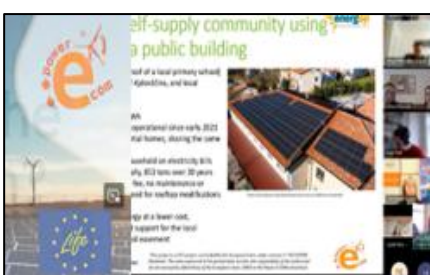
Skupnosti za obnovljive vire energije v Sloveniji: Izzivi in zgodbe o uspehu