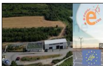
Pilotna regija v Gabrovu v Bolgariji: Gradnja lokalnih energetskih skupnosti za trajnostno prihodnost